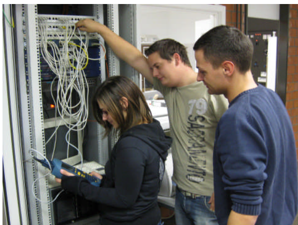
Messübungen in der Netzwerktechnik