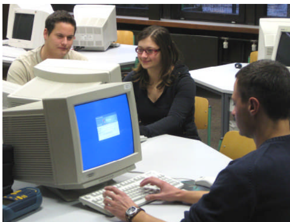
Gruppenarbeit im PC-Labor